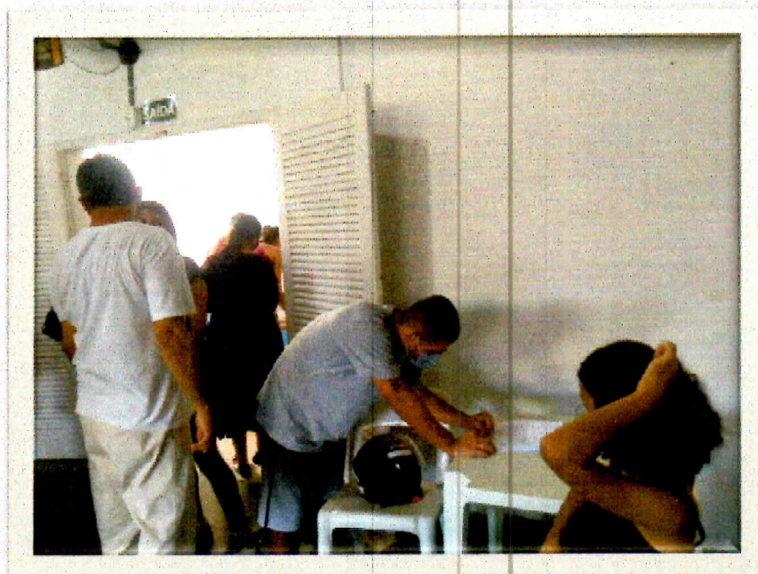
Reunião de equipe