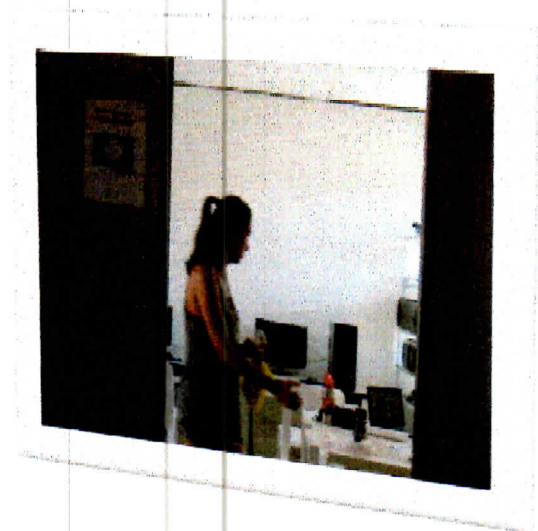
Preparação e higienização do prédio