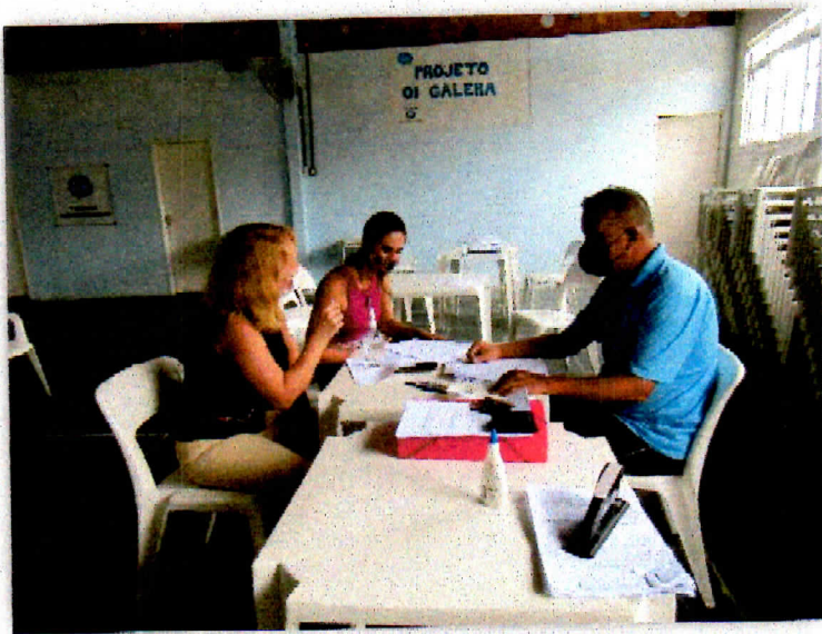
Organização e preparação das salas de aulas e manutenção nos equipamentos